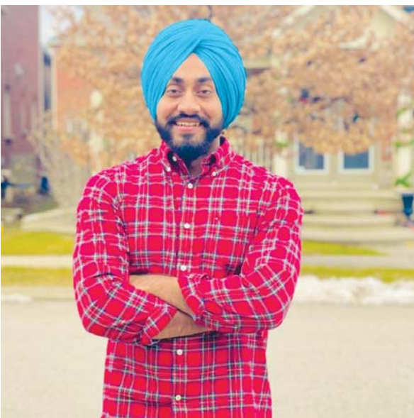
ਦੇਬਾਰਾ ਯੂ ਟਿਊਬਰ ਚੈਨਲ ਸ਼ੁਰੂ ਕੀਤਾ ਤਾਂ ਹੋਰਨਾਂ ਰਹਿ ਗਿਆ

ਪਰਨੇ ਕਿਹਾ ਜਾਂਦਾ ਹੈ, ਕਰਕੇ ਲੋਕਾਂ ਤੋਂ ਦੇਸੀ ਆਦਿ ਹੋਰ ਸੈਂਕੜੇ ਕੁਮੱਟ ਸਹਿ ਕੇ ਵੀ ਲਗਾਤਾਰ ਨਵੀਆਂ ਜਾਣਕਾਰੀਆਂ ਨਾਲ ਅੱਗੇ ਵਧਣ ਦੀ ਧੁਨ ਦਾ ਪੱਕਾ ਗੁਰਪ੍ਰਕਾਸ਼ ਹੌਲੀ ਹੌਲੀ ਮਾਲਵੇ ਦੇ ਹੀ ਇਕ ਹੋਰ ਯੂ ਟਿਊਬਰ ਮਿੰਟੂ ਬਰਾੜ ਕਾਲਿਆਵਾਲੀ ਦੇ ਚੈਨਲ ਪੇਂਡੂ ਆਸਟਰੇਲੀਆਂ ਨੂੰ ਵੇਖਦਾ ਵੇਖਦਾ ਆਪਣਾ ਛੋਟਾ ਨਾਮ ਵੀ ਮਿੰਟੂ ਸਮਾਘ ਹੋਣ ਕਰਕੇ ਆਪਣੇ ਚੈਨਲ ਦਾ ਨਾਮ ਵੀ ਪੇਂਡੂ ਕਨੇਡੀਅਨ ਰੱਖ ਲੈਂਦਾ ਹੈ। ਸ਼ੁਰੂਆਤੀ ਦੌਰ ਦੀਆਂ ਤੰਗੀਆਂ ਤੁਰਸ਼ੀਆਂ ਤੇ ਕਨੇਡਾ ਦੀ ਤੇਜ਼ ਤਰਾਰ ਜਿੰਦਗੀ ਦਾ ਸੇਕ ਮਿੰਟੂ ਨੂੰ ਵੀ ਲੱਗਦਾ ਹੈ ਤੇ ਆਰਥਿਕਤਾ ਨੂੰ ਬੇਲੈਂਸ ਕਰਨ ਲਈ ਉਹ ਸਖਤ ਮਿਹਨਤ ਕਰਨ ਦੇ ਨਾਲ ਨਾਲ ਪੜ੍ਹਾਈ ਵੀ ਕਰਦਾ ਹੈ, ਪੇਂਡੂ ਯੂ ਟਿਊਬਰ ਚੇਤੰਨ ਨਾਗਰਿਕ ਦੀ